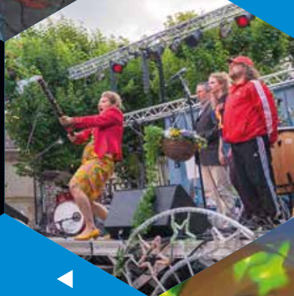
◀ Les Échappées Belles, « Le bal populaire » 14 juillet