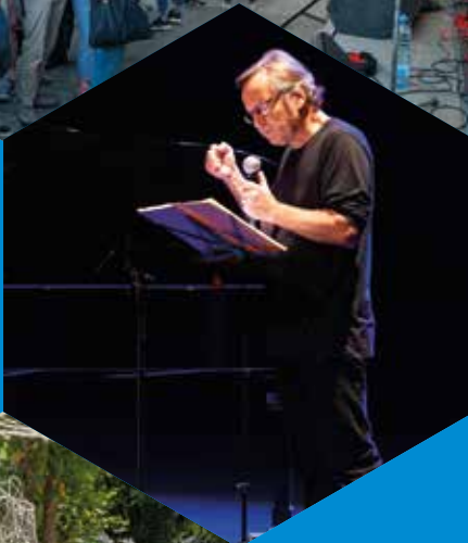
Le Centenaire de l'Armistice 14-18, « Les Forêts de Ravel » 9 novembre ▶