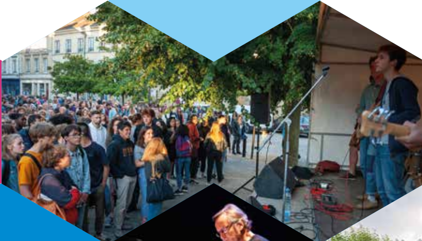
◀ La Fête de la musique 21 juin