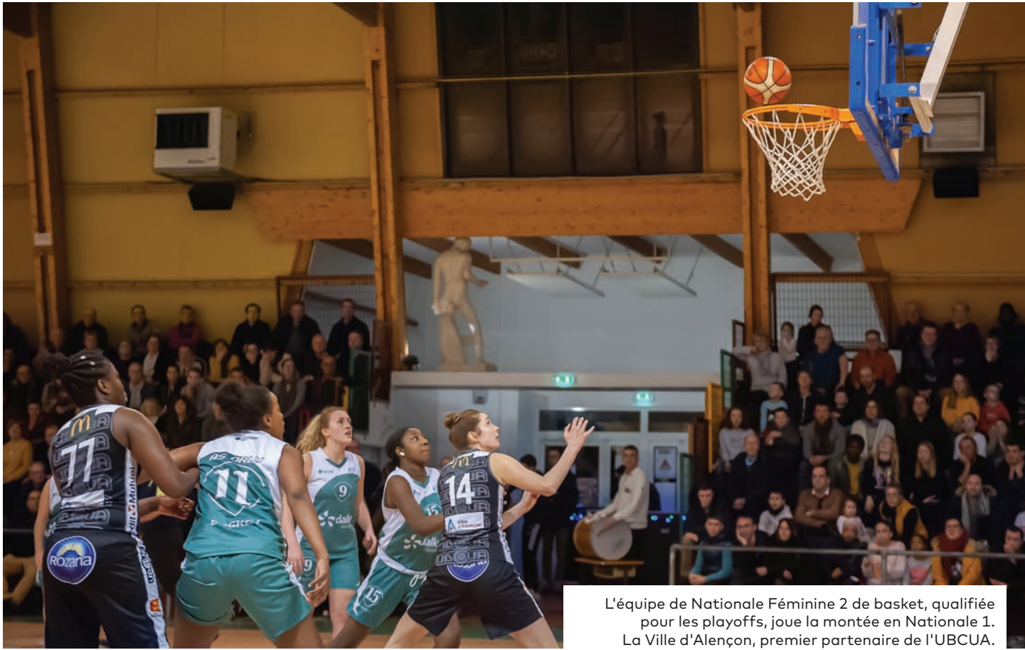
L'équipe de Nationale Féminine 2 de basket, qualifiée pour les playoffs, joue la montée en Nationale 1. La Ville d'Alençon, premier partenaire de l'UBCUA.