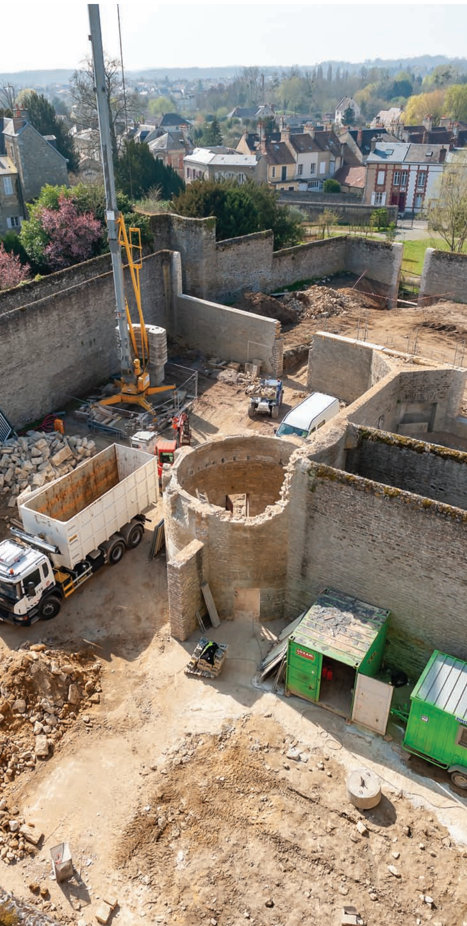
9 mars 2019 Visite du chantier des cours du Château des Ducs à l'occasion de Chantiers communs | Mois de l'architecture en Normandie.