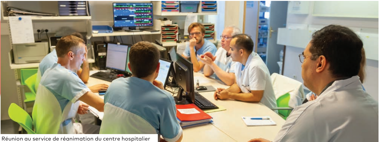
Réunion au service de réanimation du centre hospitalier