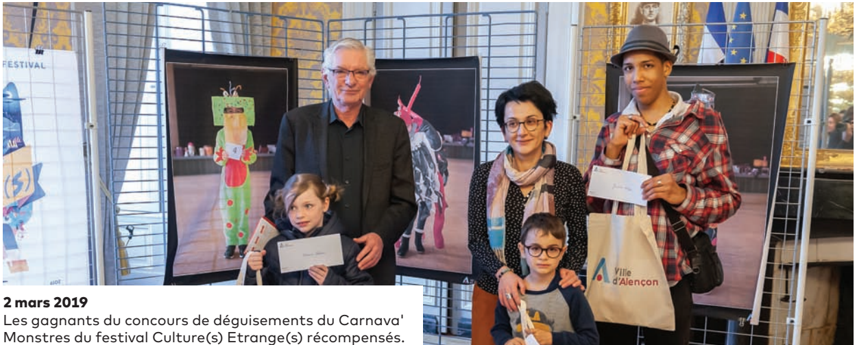
2 mars 2019 Les gagnants du concours de déguisements du Carnava' Monstres du festival Culture(s) Étrange(s) récompensés.