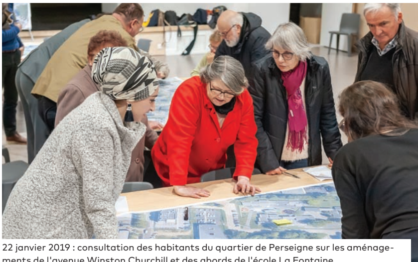
22 janvier 2019 : consultation des habitants du quartier de Perseigne sur les aménagements de l'avenue Winston Churchill et des abords de l'école La Fontaine.

La Ville d'Alençon souhaite entamer les réflexions sur les nouveaux aménagements qui pourraient être réalisés dans les années à venir. En préambule, de nombreuses réunions de concertation seront organisées jusqu'à la fin du mois de juin pour recueillir l'avis des habitants.