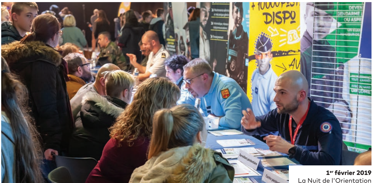
1 er février 2019 La Nuit de l'Orientation