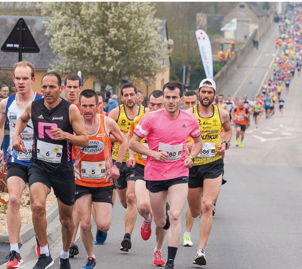
24 mars 2019 46 ème course d'Alençon Médavy