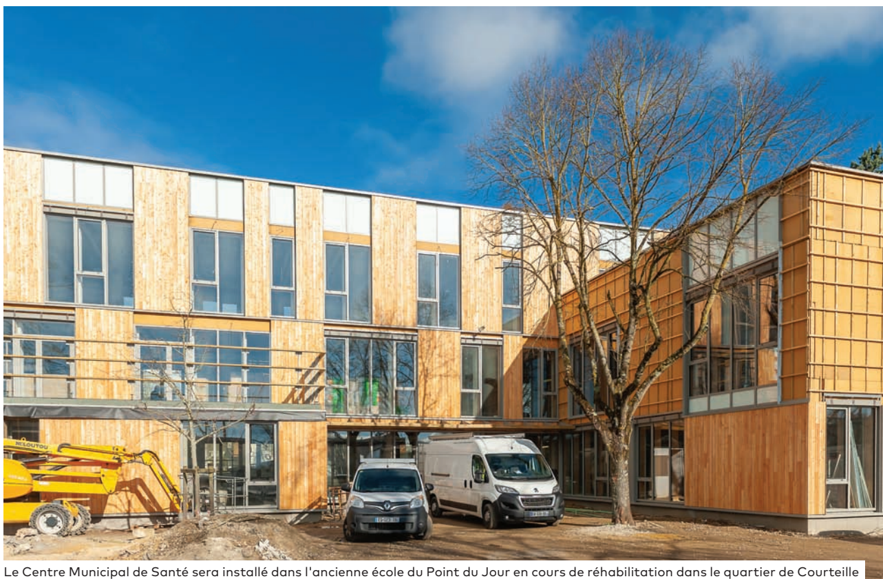
Le Centre Municipal de Santé sera installé dans l'ancienne école du Point du Jour en cours de réhabilitation dans le quartier de Courteille