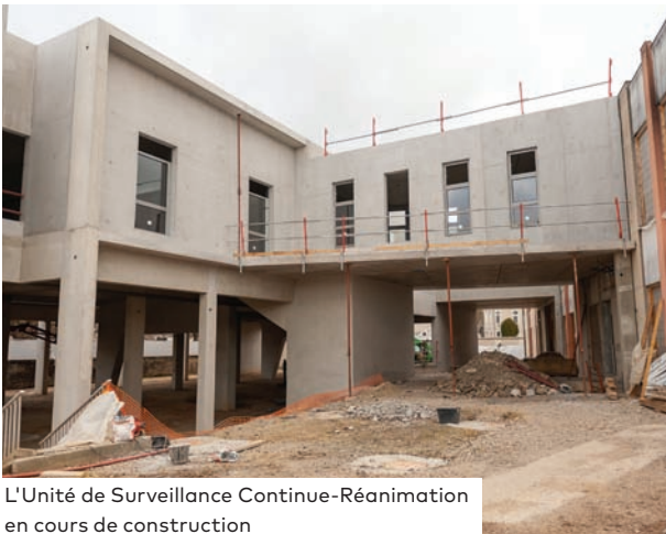
L'Unité de Surveillance Continue-Réanimation en cours de construction

Depuis janvier dernier, le service de chirurgie urologie -viscérale a été transféré sur le niveau G3 du bâtiment de chirurgie. Ce déménagement marque la première étape du grand projet du pôle de chirurgie puisque