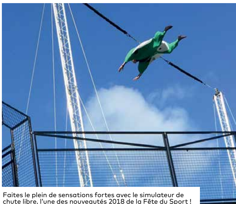
Faites le plein de sensations fortes avec le simulateur de chute libre, l'une des nouveautés 2018 de la Fête du Sport !

Samedi 15 septembre, de 14h à 18h, parc des Promenades, entrée libre.