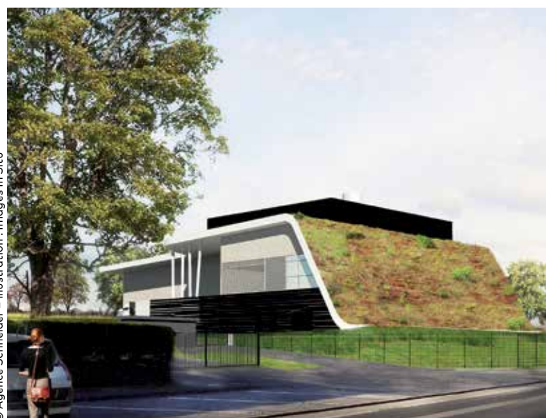
© Agence Schneider - Illustration : Images In Situ

La création de ce nouveau réseau de chaleur répond aux ambitions de la Ville et de la Communauté Urbaine d'Alençon en matière de diminution des gaz à effet de serre et de réduction du coût des énergies. À terme, l'équipement permettra de réduire la quantité de CO 2 émise dans l'atmosphère d'environ 4 400 tonnes par an. Construite derrière le lycée Alain, sur la route qui mène à Damigny, la chaufferie aura recours au bois énergie à plus de 60 %. Conformément au cahier des charges de la Communauté Urbaine, elle sera approvisionnée en bois local.