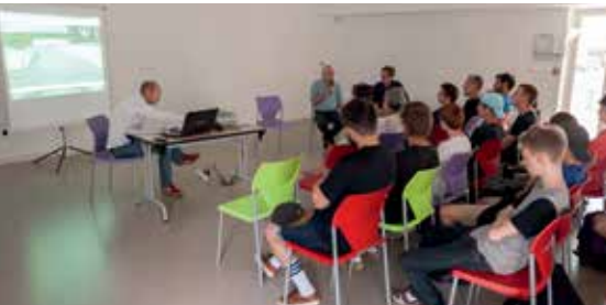
Les riders ont exprimé leurs attentes lors d'une réunion publique

Très attendu par les amateurs de glisse urbaine, le projet de construction d'un skate-park