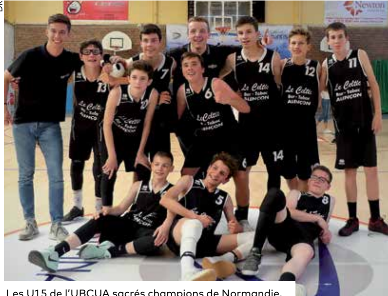
Les U15 de l'UBCUA sacrés champions de Normandie.