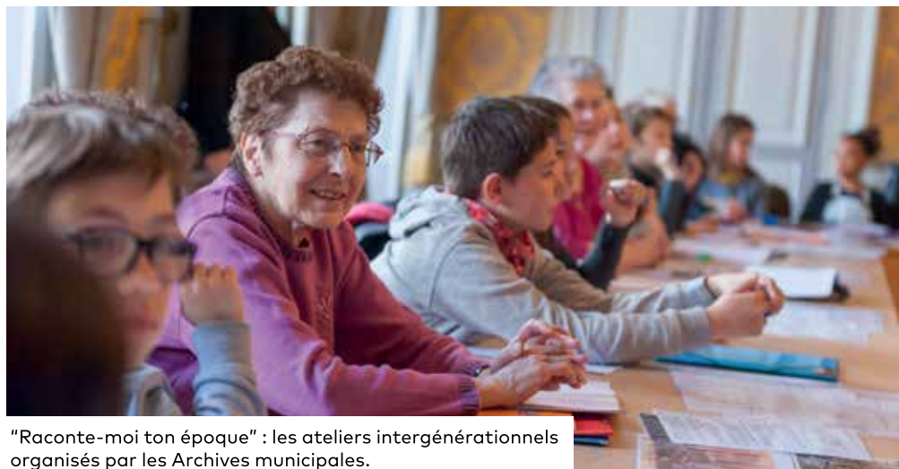
"Raconte-moi ton époque" : les ateliers intergénérationnels organisés par les Archives municipales.

Recrutement des agents secrets les samedi 15 et dimanche 16 septembre de 14h à 18h, Halle au blé, gratuit.