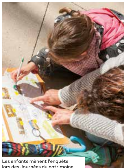
Les enfants mènent l'enquête lors des Journées du patrimoine