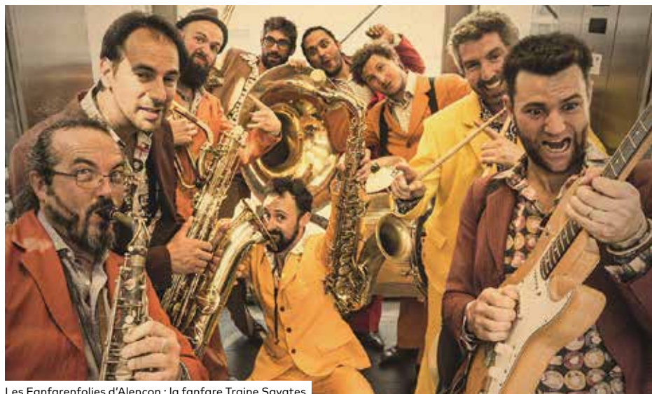
Les Fanfarenfolies d'Alençon : la fanfare Train Savates