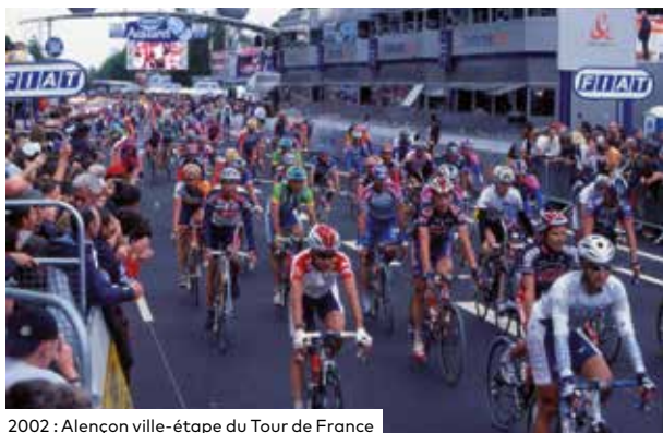
2002 : Alençon ville-étape du Tour de France

À l'occasion de cet événement, la Ville propose une exposition de cubes disséminés en centre-ville et illustrés de photos issues des Archives municipales et des collections du Musée du vélo de Villeneuve-en-