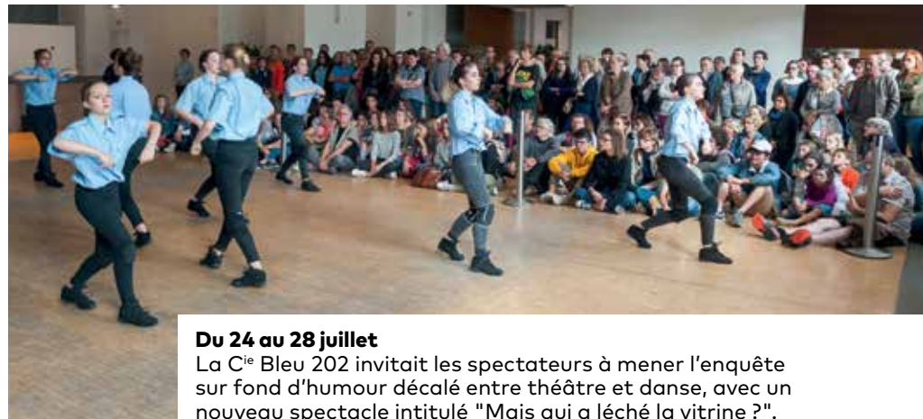
Du 24 au 28 juillet La Cie Bleu 202 invitait les spectateurs à mener l'enquête sur fond d'humour décalé entre théâtre et danse, avec un nouveau spectacle intitulé "Mais qui a léché la vitrine?".