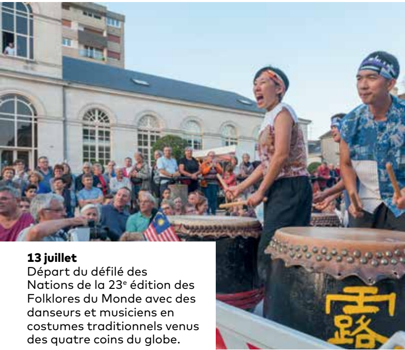
13 juillet Départ du défilé des Nations de la 23 e édition des Folklores du Monde avec des danseurs et musiciens en costumes traditionnels venus des quatre coins du globe.