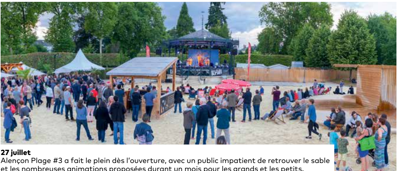
27 juillet Alençon Plage #3 a fait le plein dès l'ouverture, avec un public impatient de retrouver le sable et les nombreuses animations proposées durant un mois pour les grands et les petits.