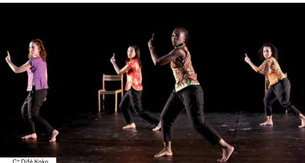
C ie Difé Kako

Tarifs variables suivant les spectacles Renseignements et réservations : http://www.jazzornedanse.fr