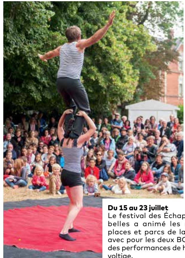
Du 15 au 23 juillet Le festival des Échappées belles a animé les rues, places et parcs de la ville avec pour les deux BOOM, des performances de haute voltige.