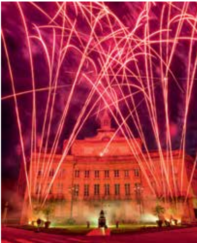
13 juillet Le feu d'artifice, point d'orgue de la fête nationale, s'est terminé dans une explosion de couleurs qui a embrasé le ciel pour le plus grand bonheur des spectateurs.