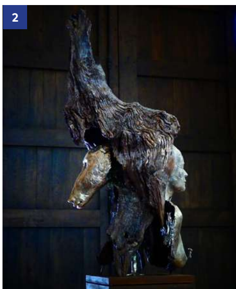
↑ 2. Nous sommes la Nature interconnectée