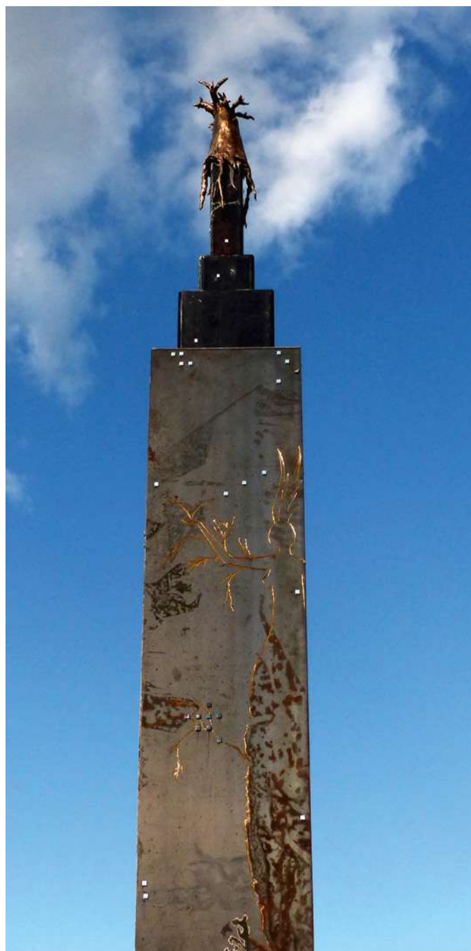
La Cité sera végétale ou ne sera pas

Face au spectateur, les sculptures projettent un univers où la cité et le végétal s'approprient et s'harmonisent. C'est également un monde où les différents règnes, animal, végétal et minéral, se mêlent, créent une symbiose salvatrice, et, ainsi, participent à la création d'un futur plus désirable, où des connexions multiples s'établissent, et surprennent parfois le visiteur. Elles révèlent d'autres possibles, des dimensions de liens invisibles qui parfois nous échappent. Les photographies illustrent quant à elles ce monde dans lequel nous évoluons, sans parfois prendre le temps de le regarder.