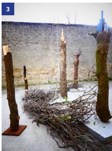
↑ 3. L'ultime lutte