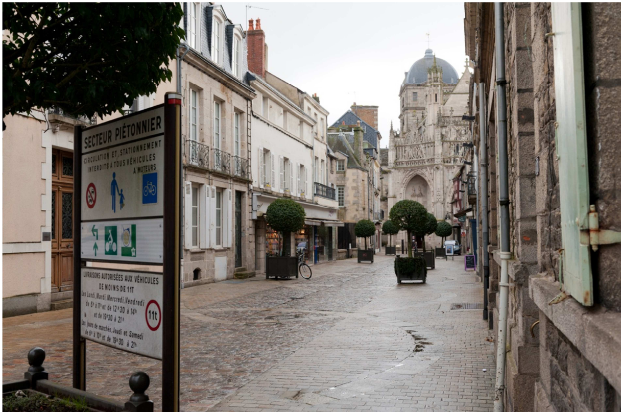
Rue du Bercail