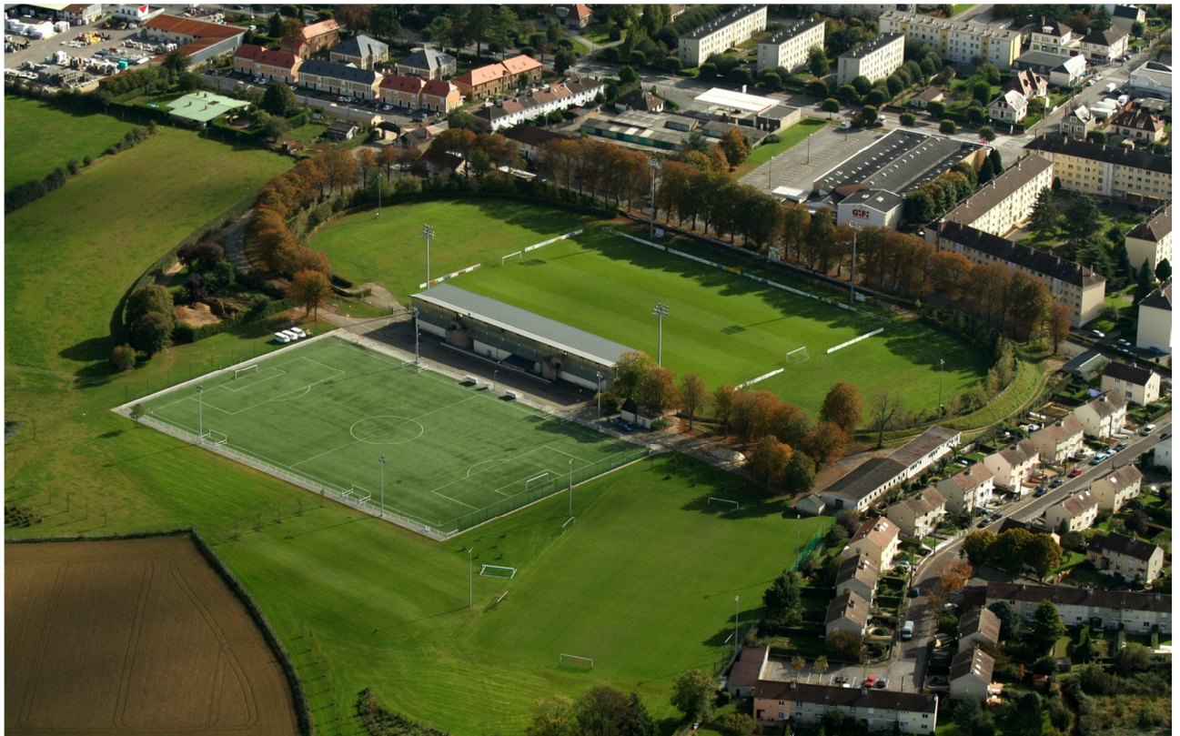
STADE JACQUES FOULD