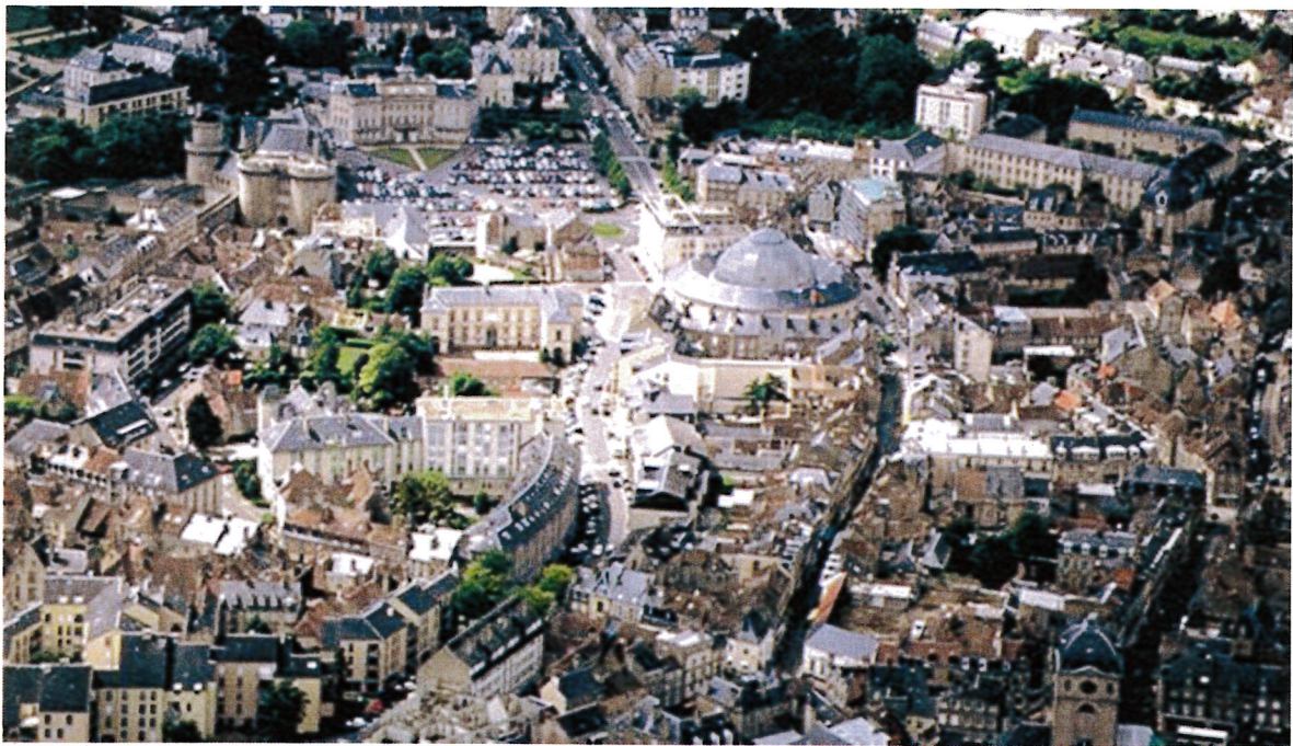
Vue aérienne du centre ville d'Alençon

VILLE D'ALENÇON RECUEIL SPECIAL INSTALLATION DU CONSEIL MUNICIPAL