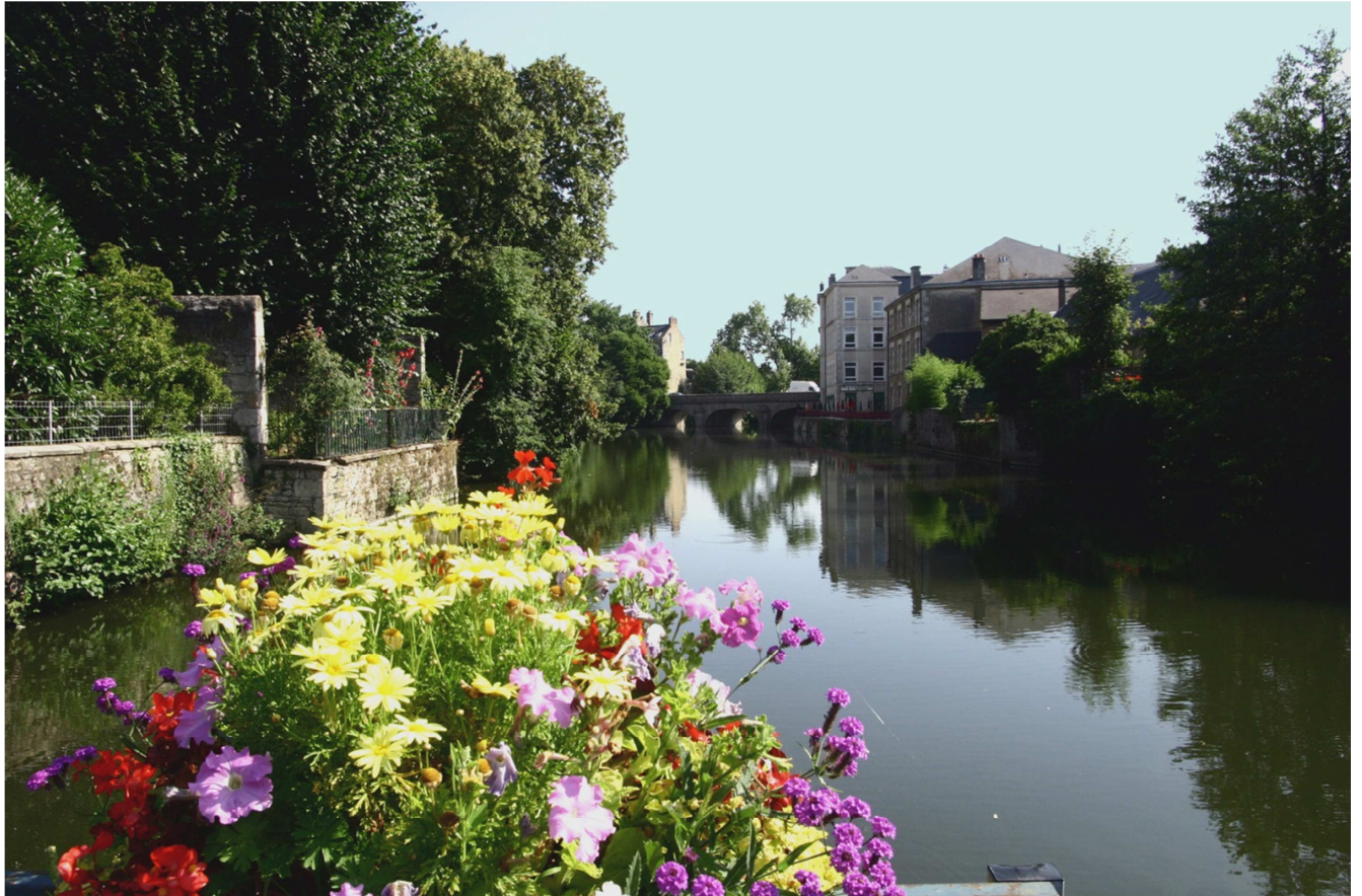
Les bords de Sarthe